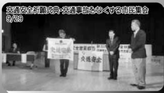
交通安全祈願式典・交通事故をなくする市民集会 9/29