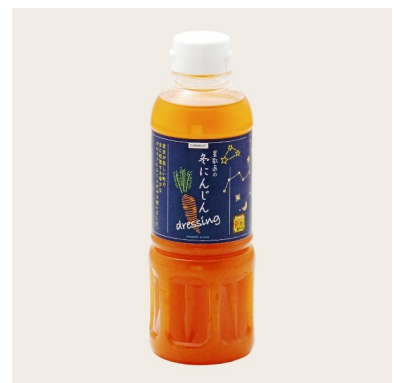
▼ 星取県の冬にんじンドレッシング