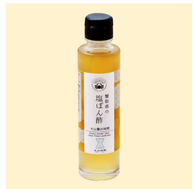
▲ 蟹取県の塩ぽん酢