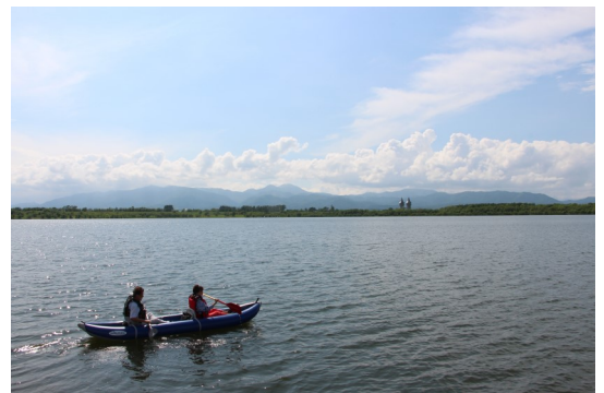
オアシスパークでカヤック体験！