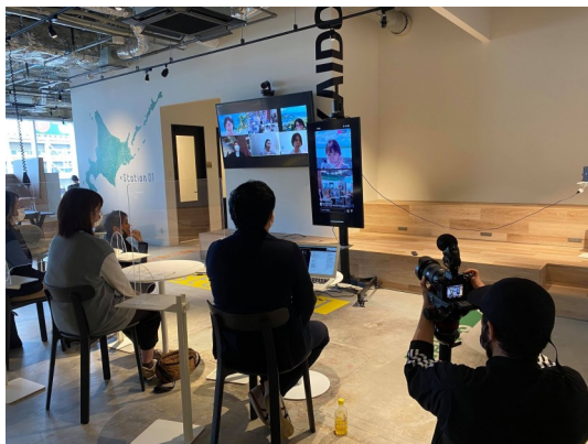
「Station01」では中継を見ながら一緒にソフトクリームバーやおでんを試食

した「HOKKAIDO × Station01 -Social Good Birth Hub-」のオープニングイベントのメイン企画として紹介され、多くの報道関係者にも砂川市の魅力を発信することができました。