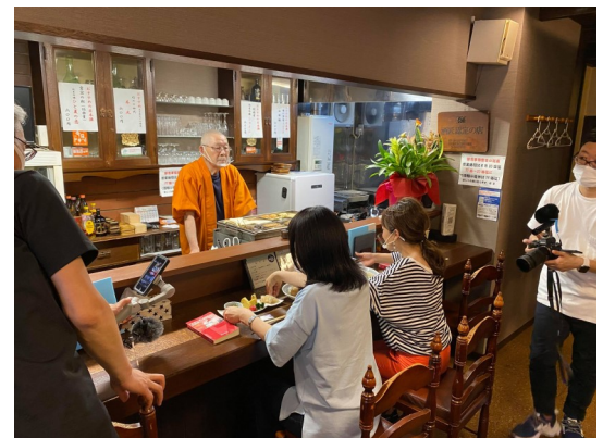
日本酒道場 橋ではおいしいおでんに舌鼓