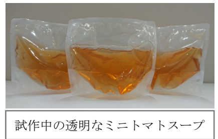
試作中の透明なミニトマトスープ

準備が整いましたら、ご報告させていただきますので、ご支援いただきますようお願いいたします。