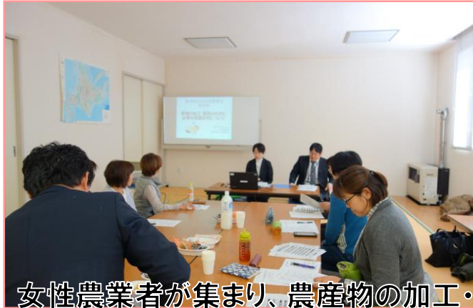
女性農業者が集まり、農産物の加工・販売等について勉強しました。