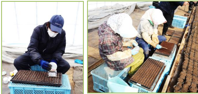
雪解け間もなくしてミニトマトの播種がはじまりました。