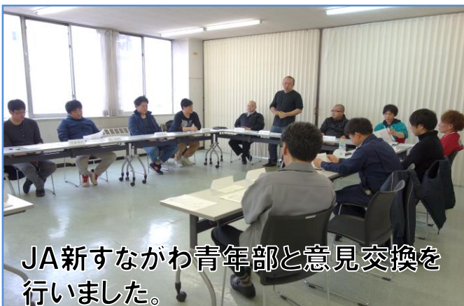
JA新すながわ青年部と意見交換を行いました。