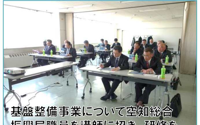
基盤整備事業について空知総合振興局職員を講師に招き、研修を行いました。