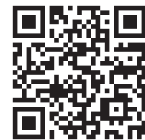
マイナポイント サイト

※一部の決済サービスにおいては、5月末以前の異なる期限を設定している場合があります。