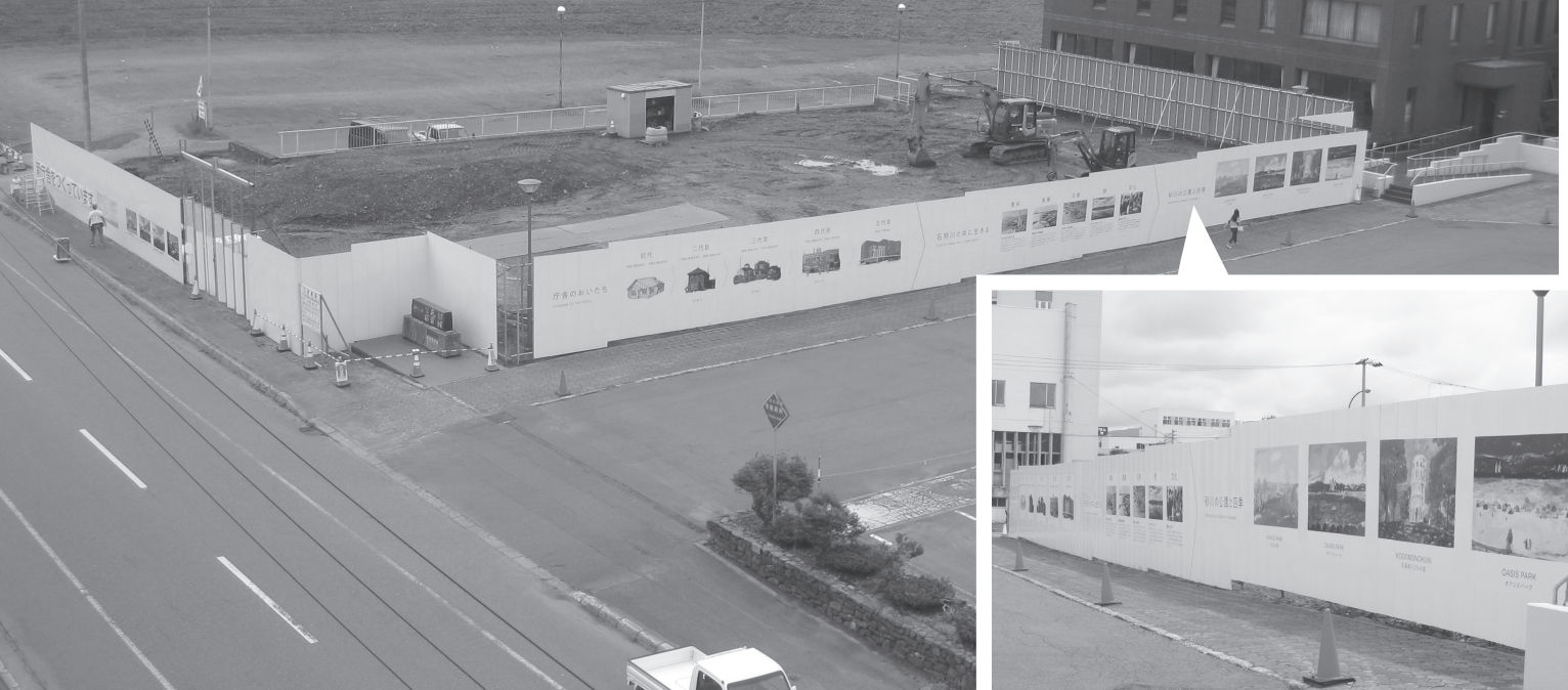
新庁舎のイメージや砂川の風景などを紹介しています。ぜひご覧ください。▶

市では、6月に完成した「砂川市庁舎建設実施設計」を基に、工事発注に向けた準備を進めてきました。この度、下記の工事施工業者と新庁舎建設工事請負契約を行いましたのでお知らせします。