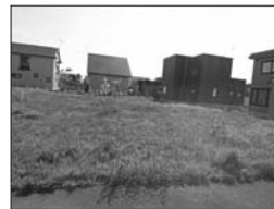
▲あかね分譲地 残り7区画