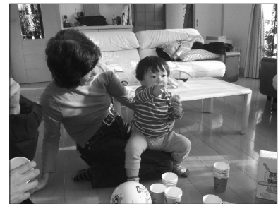
サービス利用時の様子