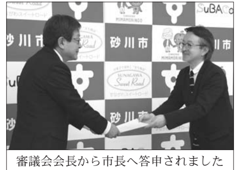
審議会会長から市長へ答申されました

現在、基本構想（案）についての市民意見を募集しており、その意見を踏まえて、市としての庁舎建設基本構想が策定されます。