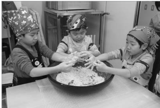
●みんなで一生懸命そば粉を練っています

「ゆう手打ちそば講座」が行われ、家族連れなどの多くの方が参加し、年越しそばを作りました。講座では、砂川手打ちそば愛好会の方々が講師となって、優しく丁寧に作り方を教えてくれたので、初めての子どもでも立派なそばを作ることが出来ました。自分たちが作ったそばで良い年越しを迎えられたことでしょう。