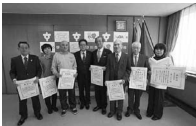
受賞者の皆さまと記念撮影