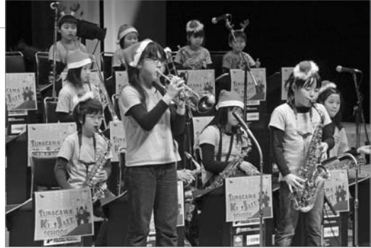
●2人で息もぴったり

ゆうの開館10周年を記念し、クリスマスジュニアジャズライブインゆうが開催されました。砂川キッズジャズスクールのほか、札幌と幕別のジュニアジャズスクールが参加し、総勢約60人のライブが行われました。観客からはリズムに乗った手拍子と拍手が送られ、クリスマスをjazzで楽しみました。