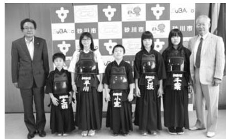
これからも頑張ってください!!