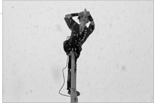
●高さ6・6メートルの梯子を披露

今年1年の無災害を祈願する新年恒例の「消防出初式」が行われました。雪が降るなか、消防職員等による分列行進のあと、はしご乗りが行われました。3人の団員がみごとな演技を披露すると、見物に来ていた人たちから歓声があがっていました。火事などが起きないように十分注意して1年を過ごしましょう。