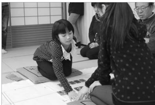
●かるたで真剣勝負!

百人一首まつり「下の句かるた大会」が開催され、子ども3チーム、大人6チームが参加し、各世代がかるたを通じて交流しました。大会後のアンケートでは「相手の札を取ったとき、すごく気持ちよかった」「若いころを思い出し楽しかった」などの感想が寄せられ、参加者はかるた大会を大いに楽しんだ様子でした。