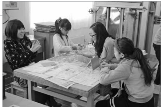
●冬休みの自由研究かな?

生活リズムが乱れがちな冬休みに、朝から楽しめるイベント「子どもわくわく朝活!」が行われました。14日の「親子おこづかい教室」では、ボードゲームを通してお金の上手な使い方や大切さを学びました。15日の「ものづくり体験」では、モザイクキャンドルとオリジナルデザインの写真立てを作りました。