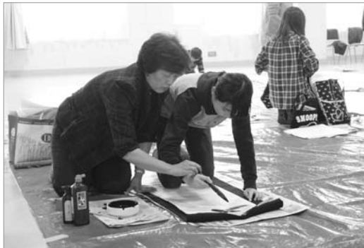
●上手に書けるかな?

新春書き初め大会が行われ、子どもから大人まで幅広い世代の参加者が集まりました。書き初めは年齢ごとに課題が用意され、「さる」や「春眠不覚暁」などの課題にそれぞれが取り組みました。子どもたちは砂川書道連盟の方々の指導によりめきめき上達していきました。なかには大人顔負けの達筆な子どももいました。