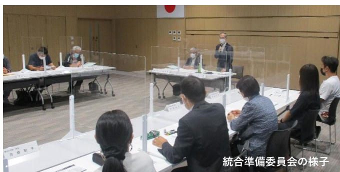
統合準備委員会の様子