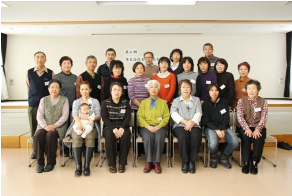
修了者のみなさんです