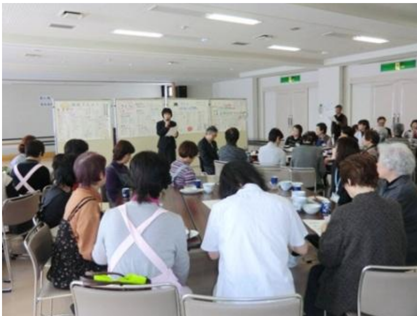
試食後の講評も真剣に聞いています

今後は食の安全・安心とともに、砂川市民の健康は食生活からの思いでご活躍されますことを心よりお祈り申し上げます。