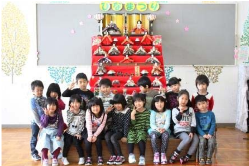
空知太保育所 クラスごとに記念撮影