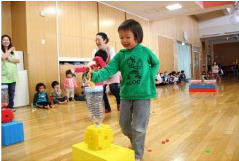
さくら保育園 ひなあられゲーム