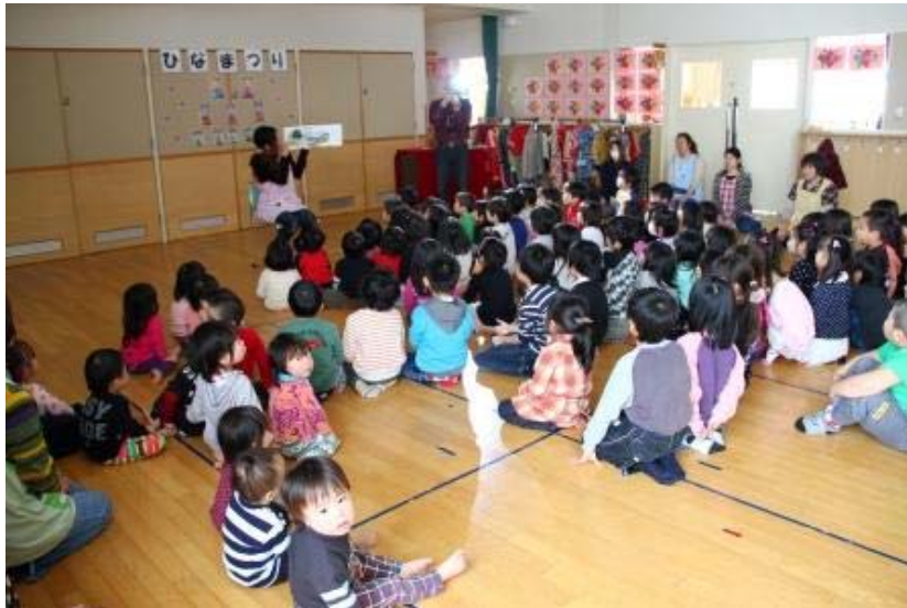
ひまわり保育園 先生による読み聞かせ(カメラの方が気になる子ども)