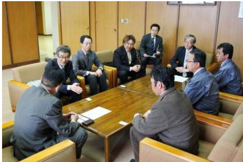
24年度のユメピリカは、すでに6割がた売れてしまったとのこと。端境期の分がなくなってしまうのではと心配していました。