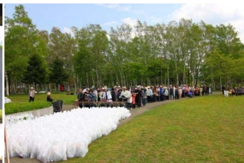
花の苗無料配布は、毎年大盛況