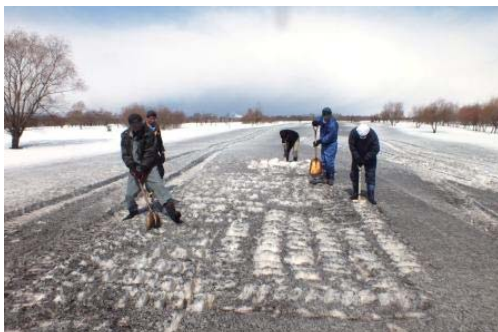
融雪剤散布と雪割りの様子