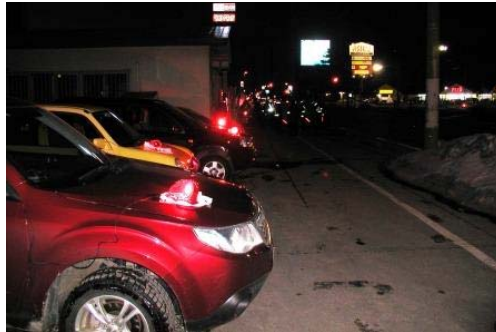
豊沼交番前パトライト