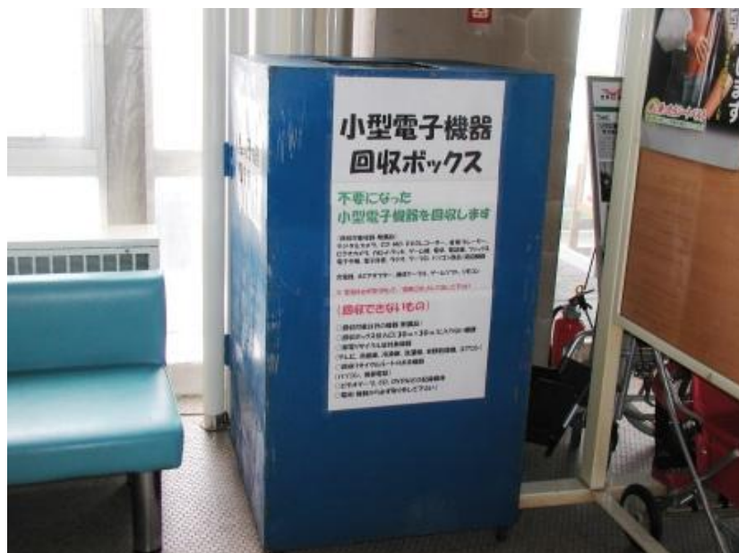
正面玄関から入って右側、ジュースの自動販売機付近にあります