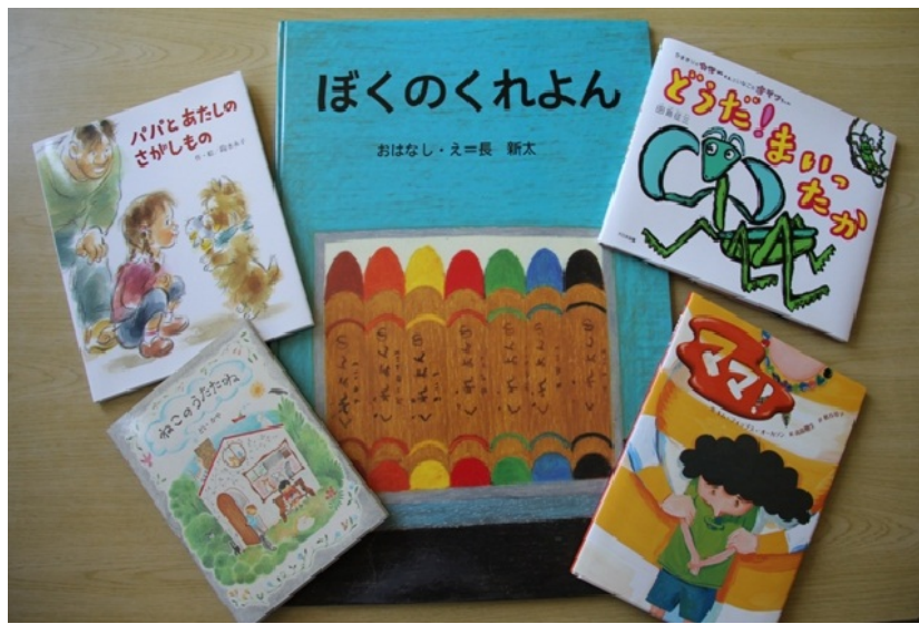
寄贈された絵本の一部です