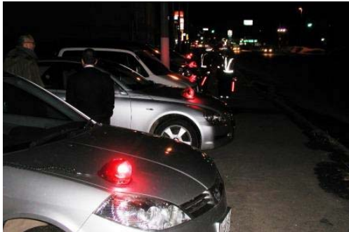
北洋砂利前パトライト