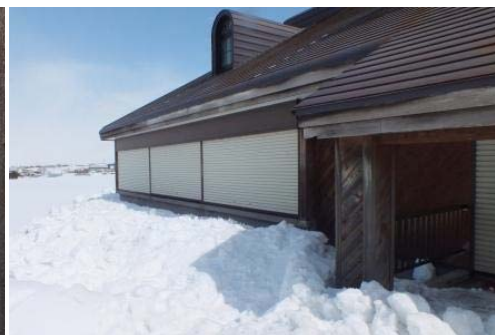
スッキリしましたが、まだまだ雪は多いです