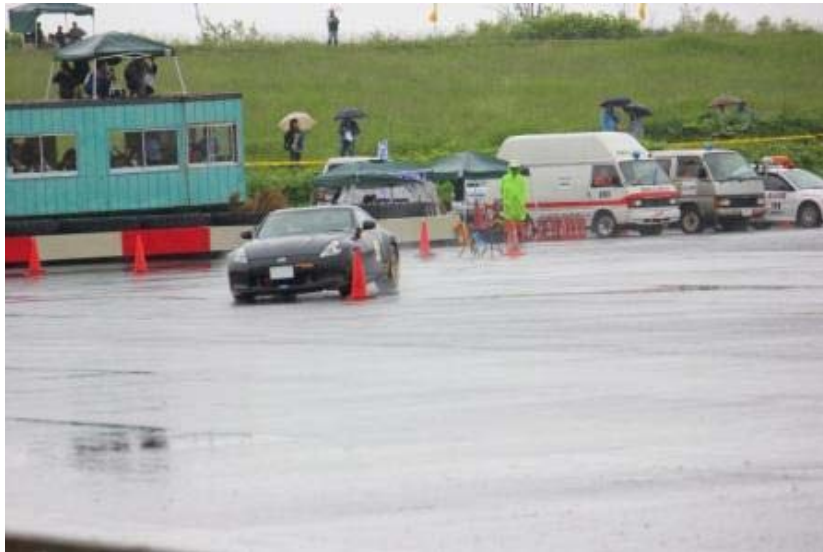
水しぶきを上げながらの疾走