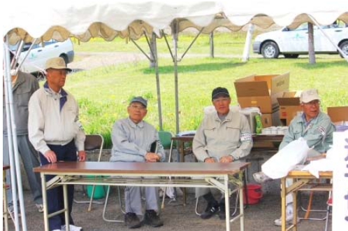
推進市民会議の役員のみなさんです