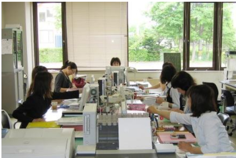
ふれあいセンターの保健師・栄養士のみなさんです。

市民の皆様が健康で明るい生活を送ることが出来ますよう、効果的で丁寧な保健活動を心がけておりますので、今後におきましてもご協力をお願い申し上げます。