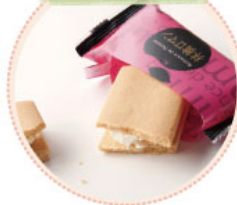
ほんだの林檎ロマン