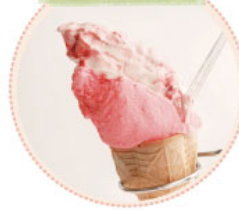
岩瀬牧場のジェラート