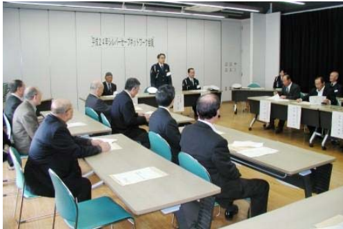
シルバーセーブネットワーク会議