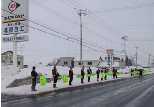
北星自工の皆さま

市民の皆様にも交通安全の推進及び新入学児童の交通事故防止のため、ご協力をお願い申し上げます。