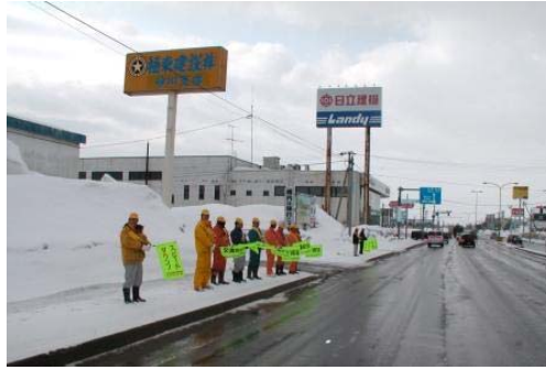
極東建設の皆さま