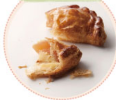
ナカヤのアップルパイ