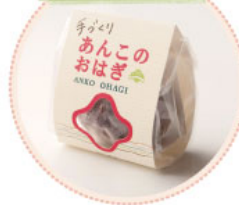
吉川食品のおはぎ