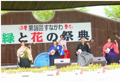
砂川三弦会のみなさん