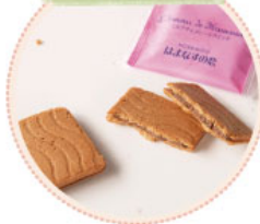
北葉楼のはまなすの恋