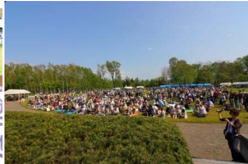
たくさんの人たちが来てくれました