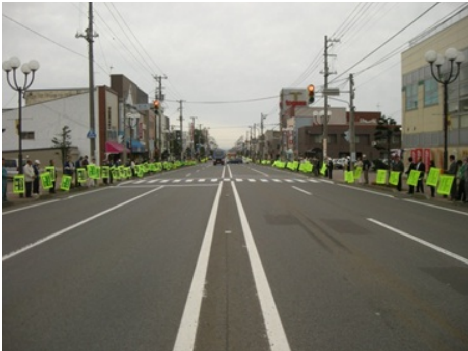
昨年(H23.9.21)の「砂川市民を交通事故から守る一斉旗の波運動」

交通安全推進委員会の役員・委員の皆様には、大変お忙しいなか出席いただきお礼申し上げます。今後とも交通安全の推進にご尽力下さるようお願い申し上げます。