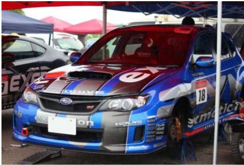
きれいなカラーリング