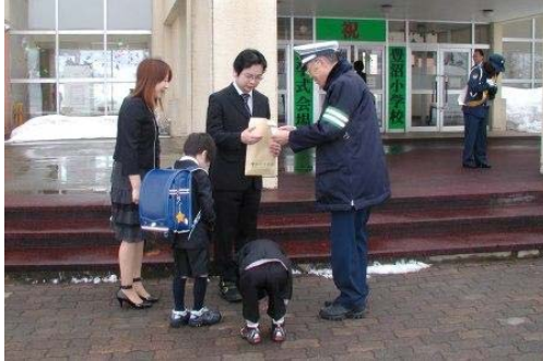
豊沼小学校の新入学児童